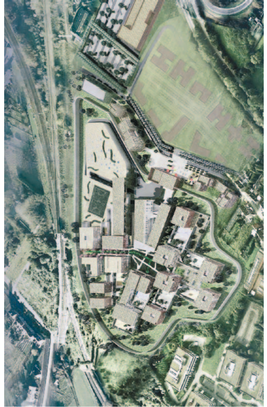
fig. H Aandacht voor integratie in de omgeving.