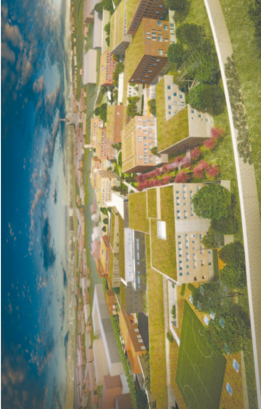
fig. G Ommuurd dorp in een dorp.